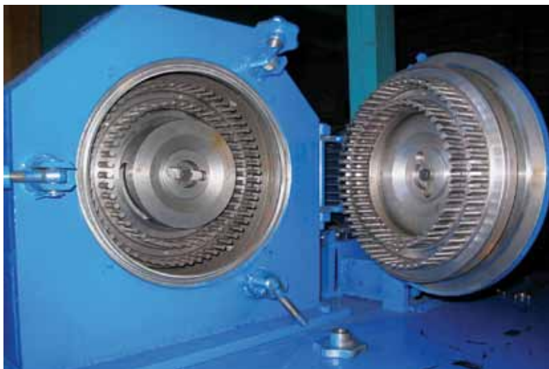
Рис. 1. Мельница-дезинтегратор